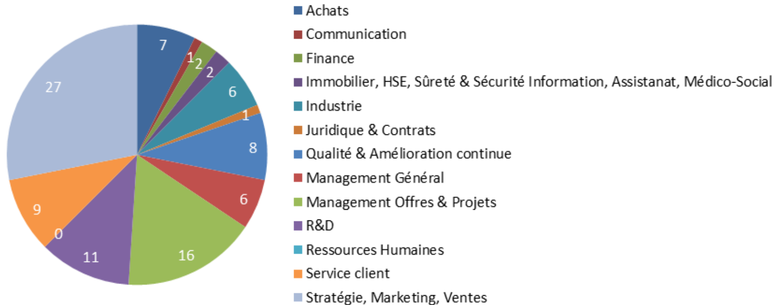
Cartographie métiers de l'ensemble des salariés volontaires