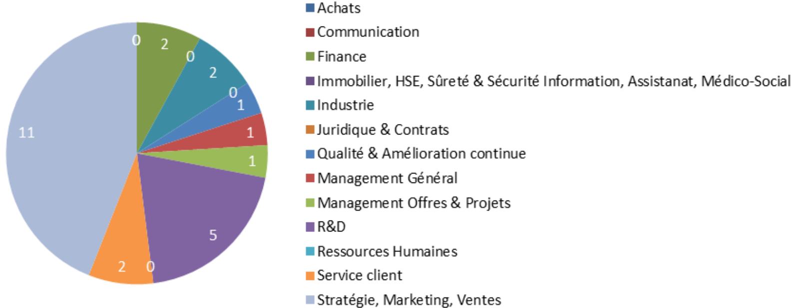
Cartographie métiers des détachements en cours et achevés